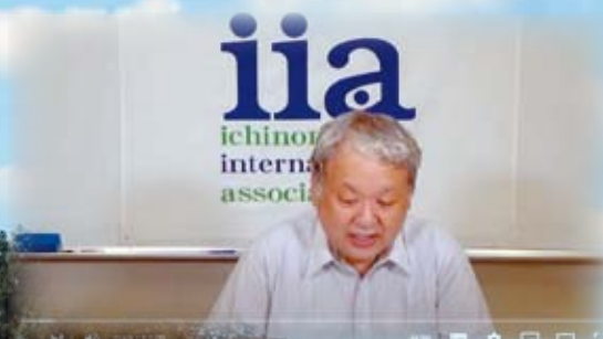
「外国人児童生徒向けオンライン進路説明会」4P