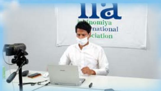
「グローバルサマーセミナー・オンライン」3P