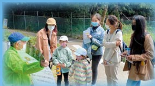
「国際交流ふれあいウォーキング」2P