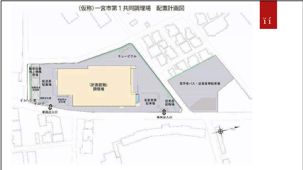
(仮称)一宮市第1共同調理場 配置計画図