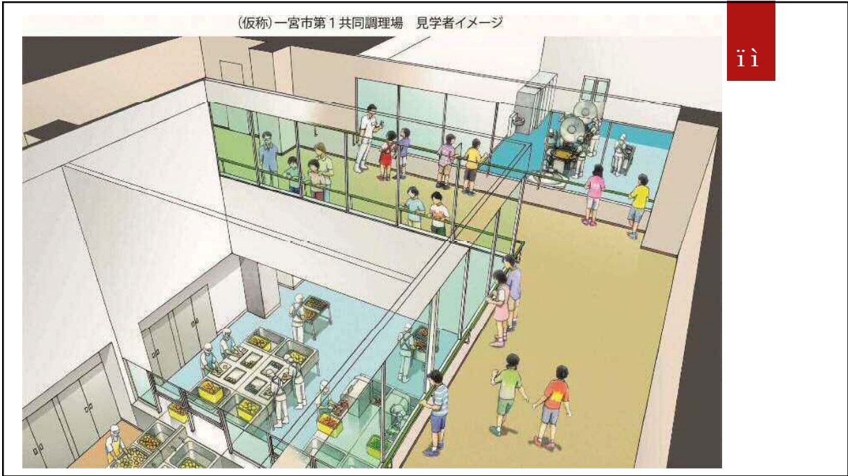
(仮称)一宮市第1共同調理場 見学者イメージ