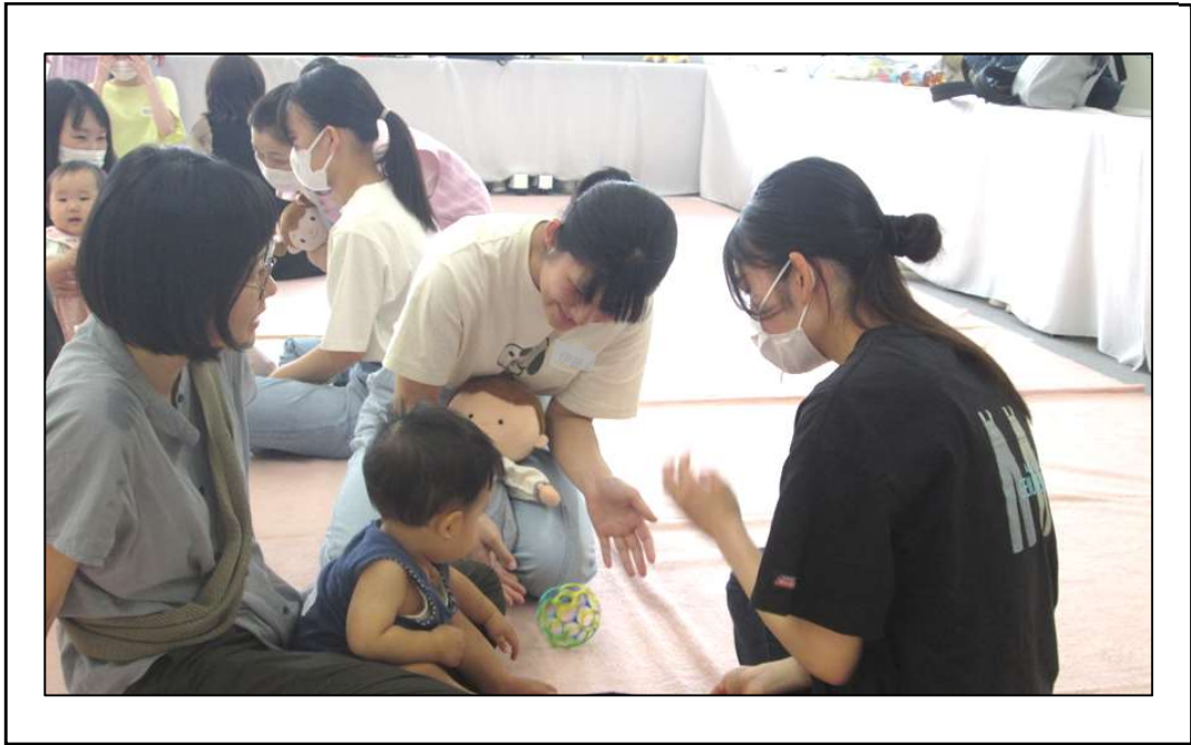
「赤ちゃんふれあい体験」にて