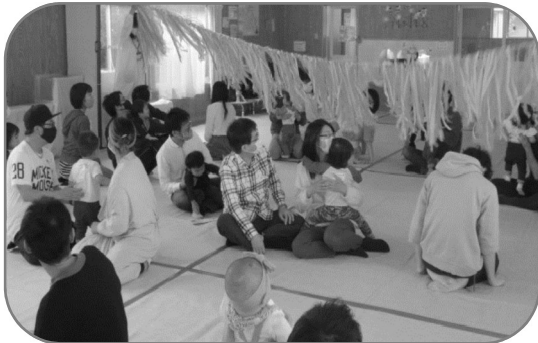
<黒田北子育て支援センターにて>