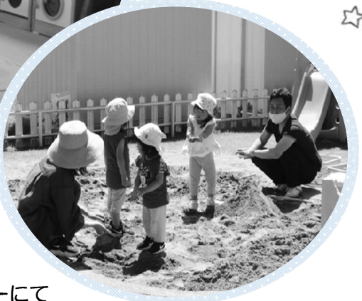
黒田北子育て支援センターにて