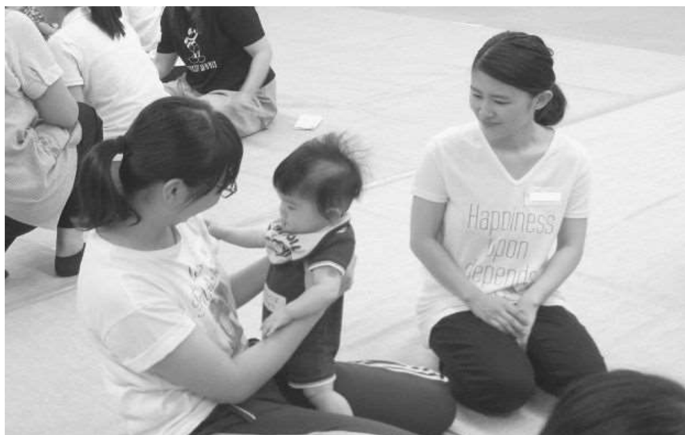
赤ちゃんふれあい体験