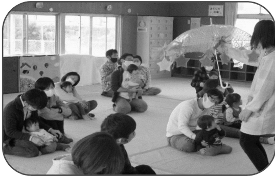
<里小牧子育て支援センターにて>