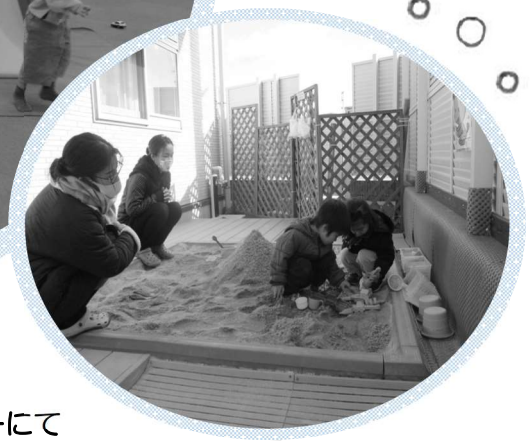
千秋子育て支援センターにて